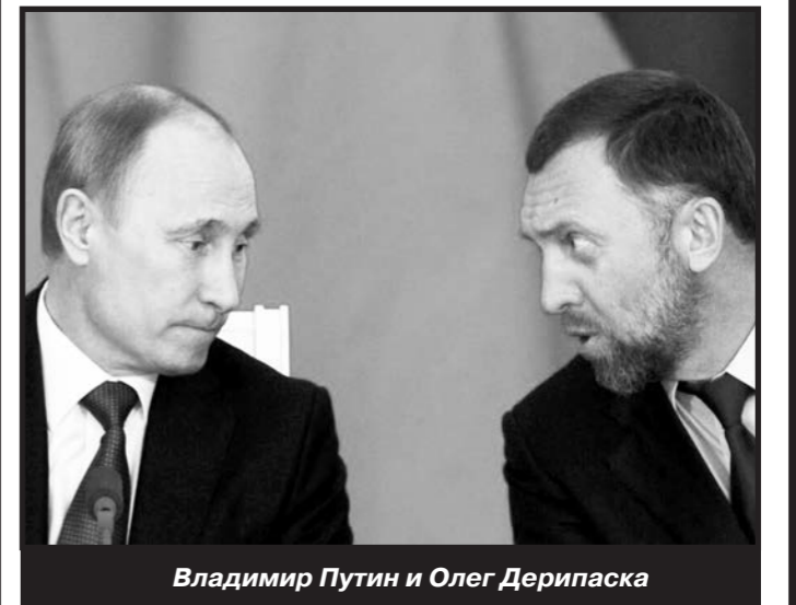
Владимир Путин и Олег Дерипаска

Ну, это, типа, когда заплатил, то есть откупился, и всё, ты вроде как теперь на веки вечные законный владелец некоего народного достояния, и поправка закона при «приватизации» больше не считаются нарушением.